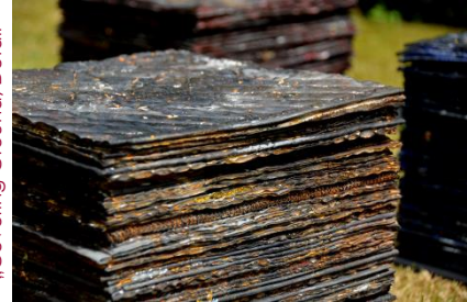
Mirjam Pet-Jacobs „Covering Ground, Detail“

Ist das Erkennen von Objekten durch drastische Veränderungen wie zum Beispiel Vergrößerung, Verkleinerung oder Perspektivwechsel nicht mehr möglich, müssen Imagination und Fantasie die Zuordnung des Gesehenen übernehmen.