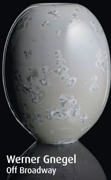
Werner Gnegel Off Broadway