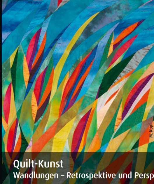
Quilt-Kunst Wandlungen – Retrospektive und Perspektive