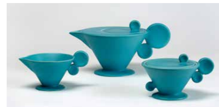
7 Teile eines Teeservice, um 1929