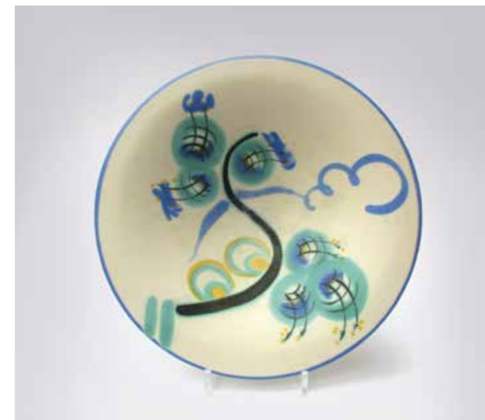
6 Obstschale, um 1930