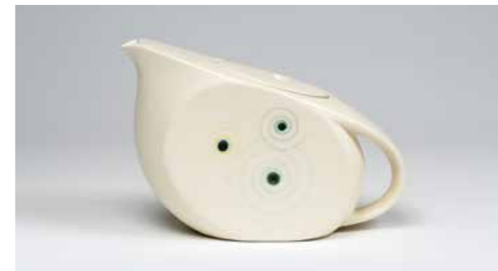
8 Teekanne aus dem „Bauhaus-Service“, um 1929