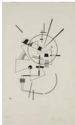
2 Wassily Kandinsky, Lithografie Nr. II, Weimar/Dessau, 1925