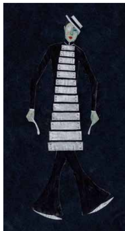
5 „Le Xylophone. Costume pour un ballett“, Mannheim, 1929