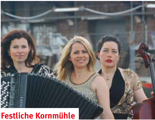
Foto: Trio Con Abbondono