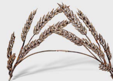
3 Ceres-Diadem 1. H. 19. Jh. Private Collection