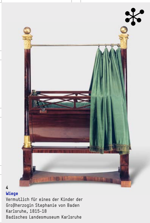
4 Wiege Vermutlich für eines der Kinder der Großherzogin Stephanie von Baden Karlsruhe, 1815-18 Badisches Landesmuseum Karlsruhe