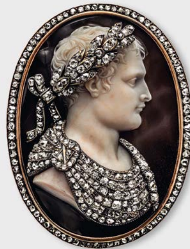
1 Brosche mit Porträt-Kamee Napoleons Nicola Morelli, frühes 19. Jh. Albion Art Collection