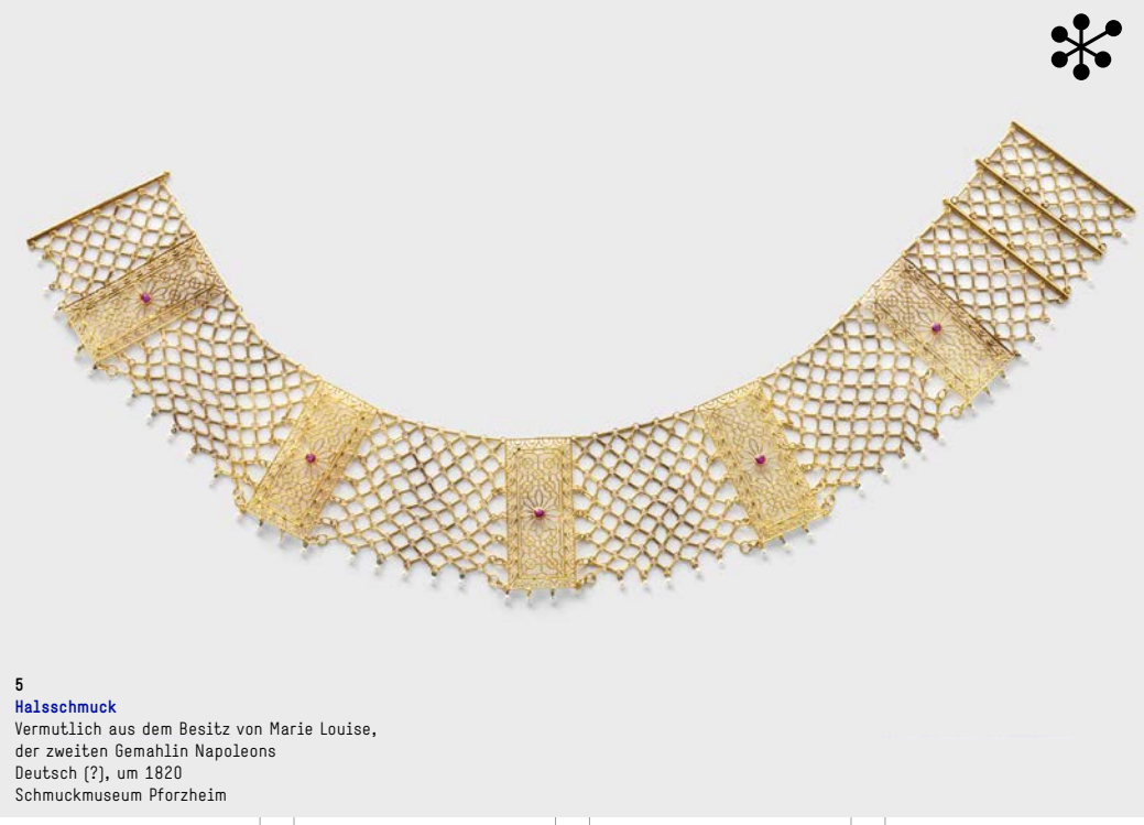
5 Halschmuck Vermutlich aus dem Besitz von Marie Louise, der zweiten Gemahlin Napoleons Deutsch (?), um 1820 Schmuckmuseum Pforzheim