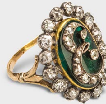
2 Diamantring von Eugène de Beauharnais Napoleonmuseum Thurgau, Schloss und Park Arenenberg

The jewellery of Napoleon's era was very different from that created before the French Revolution: it was more unobtrusive, but no less precious; rather, it was even more valuable. Its formal idiom was reminiscent of the Biedermeier style: delicate and, unlike the pompous Baroque jewellery, sleekly simple and finely crafted, gilded