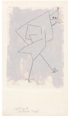
Paul Klee, höherer Vogel 1940, 73, Kreide auf Papier auf Karton, 29,5 x 20,9 cm Zentrum Paul Klee, Bern