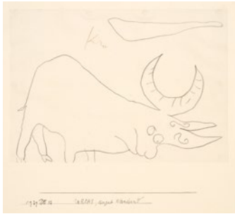
Paul Klee URCHS, bergab wandernd 1939, 1033 Kreide auf Papier auf Karton 20,8 x 29,6 cm Zentrum Paul Klee, Bern