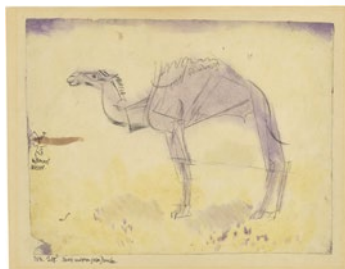
Paul Klee Studie nach einem greisen Dromedar , 1914, 208 Feder und Aquarell auf Papier auf Karton 21,8/21,2 x 27,5/28,2 cm Privatbesitz Schweiz, Depositum im Zentrum Paul Klee, Bern

Paul Klee Insecten , 1919, 114 (Ausschnitt) kolorierte Lithografie 20,6 x 14,7 cm Sammlung E.W.K., Bern