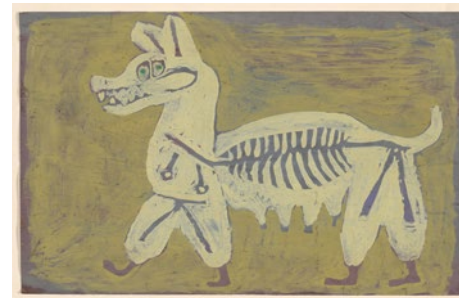
Paul Klee Muttertier , 1937, 32 Ölfarbe auf Papier auf Karton 20,9 x 32,8 cm Zentrum Paul Klee, Bern

Dabei denkt Klee auch über die Unterschiede von Mensch und Tier nach und beobachtet und erkundet in seinen Werken typische Rollen, Eigenschaften und Verhaltensweisen. Mit seinen zutiefst menschlichen Tieren und vertierten Menschen hinterfragt er unser Verständnis von Mensch und Tier und schafft eine irritierende, oft heitere bis ironische Distanz. Das Verständnis dieser eigenen künstlerischen Welt verdeutlichen auch die eigenwilligen, oft ironischen Titel, die der Künstler jedem Werk gibt, ohne dabei die Fantasie des Betrachters in eine einzige Richtung zu lenken.