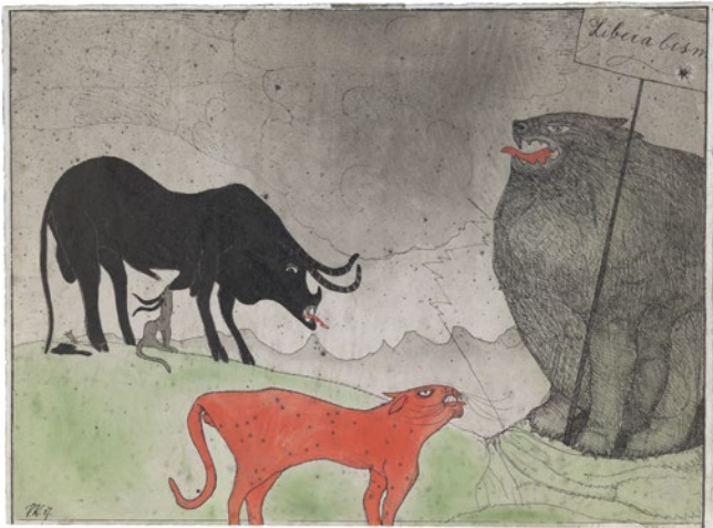
Paul Klee, Konzert der Parteien , 1907, 14, Feder und Aquarell auf Papier 24,2 x 33 cm, Zentrum Paul Klee, Bern

Paul Klee schreibt 1904 in sein Tagebuch: „Zwei Berge gibt es auf denen es hell ist und klar, den Berg der Tiere und den Berg der Götter. Dazwischen aber liegt das dämmerige Tal der Menschen“. Mit diesen Zeilen beschreibt der Mensch Paul Klee seine Sicht auf die Tiere, die er dem Göttlichen gleichstellt. In Klees umfangreichem künstlerischen Werk finden sich zahllose Darstellungen von Tieren. Sie bewegen sich zwischen der Erkundung der Natur, der Erschaffung geheimnisvoller Kreaturen und humorvollen Kommentaren zum vielschichtigen Verhältnis von Mensch und Tier. Klee lässt sich durch die unendliche Formenvielfalt der Natur anregen und stellt seine Vorstellungskraft mit der Erfindung von Mischformen und neuen Tierarten unter Beweis.