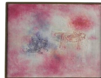
Paul Klee Sie brüllt, wir spielen , 1928, 70 Ölfarbe auf Leinwand; originale Rahmenleisten 43,5 x 56,5 cm Zentrum Paul Klee, Bern