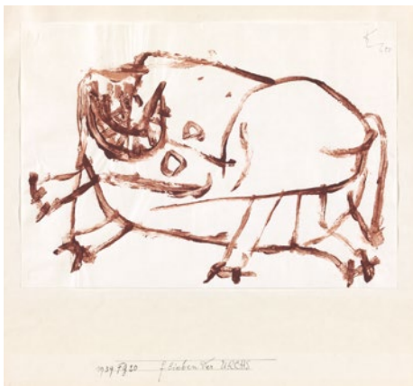
Paul Klee fliehender URCHS 1939, 1080 Kleisterfarbe auf Papier auf Karton 20,8 x 29,5 cm Zentrum Paul Klee, Bern

Die Internationalen Tage Ingelheim zeigen dieses tierische Universum Klees erstmals in Deutschland. Dabei werden viele Facetten der Beziehungen zwischen Mensch und Tier bzw. auch umgekehrt aufgezeigt. Sie verdeutlichen, mit welcher Intensität und spielerischer Hintergründigkeit der in der Schweiz geborene Bauhauskünstler Paul Klee (1879–1940) in seinem gesamten künstlerischen Schaffen das Tierische im Menschen und das Menschliche im Tier hervorhebt. Die Ausstellung zeigt thematische Werkgruppen wie Mensch und Tier, Mischwesen, Katzen (dem Lieblingstier von Klee), Vögel und dem URCHS, einer vom Künstler erfundenen Tierart.