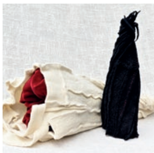
Pascale Goldenberg Male-Female