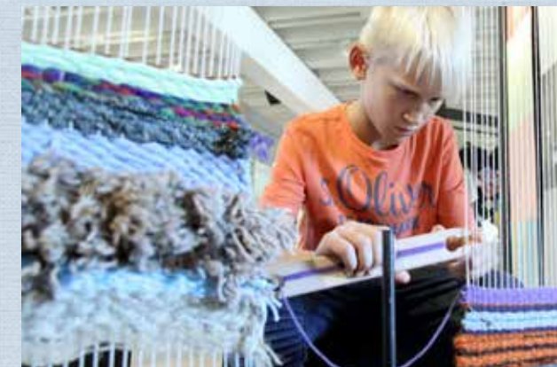
Mitmach-Station „Weben“ Stadt- und Industriemuseum Rüsselsheim

Sa | 03.06. | 11:30-15 Uhr Gib Stoff! trifft Maker Space (ab 14 Jahren) „Fashion-Freaks gesucht!“ Den Startpunkt bildet eine Mitmach-Führung in der Sonderausstellung. Im Anschluss lernt ihr die Nähmaschinen im Maker Space kennen und fertigt eure ersten individuellen Textilprojekte an. In Kooperation mit der experimenta Heilbronn. Kostenfrei zzgl. Eintritt und Beitrag Maker Space 8 Euro. Anmeldung erforderlich