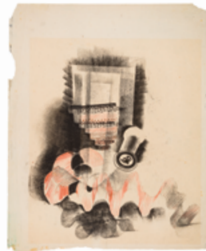
Links: Komposition mit Spirale , 1919–1923, Linolschnitt 50 × 33,8 cm, Inv.Nr. 8700 / Rechts: Stilleben (mit Spule) , um 1920, Kohle, Bleistift Buntstift auf Papier, 49 × 39 cm, Inv.Nr. 8699