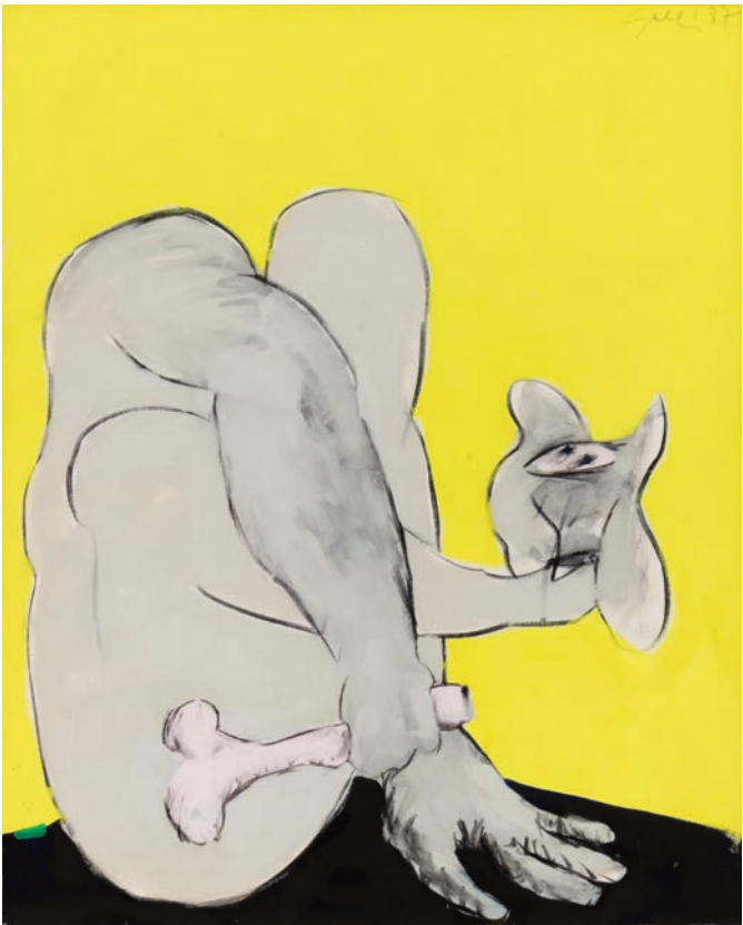
Galli, Wer das Gelbe nicht ehrt... , 1981/1987

Die seinerzeitigen Kritiken schwankten zwischen widerwilliger Bewunderung und herablassender Missachtung. Diese Urteile gipfelten in der Aussage des Kunstkritikers des einflussreichen TIME Magazine , James Stern, der die Ausstellung mit der Begründung ablehnte, dass es noch nie eine „erstklassige Künstlerin“ gegeben habe. Was für ein Irrtum schon damals!