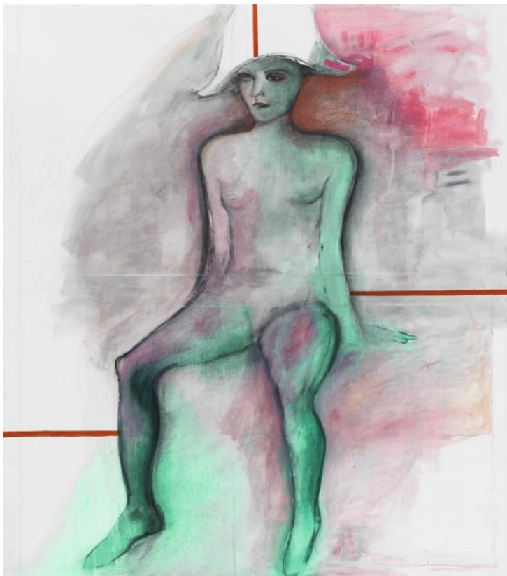
Leda Bourgogne, Eccomi , 2018