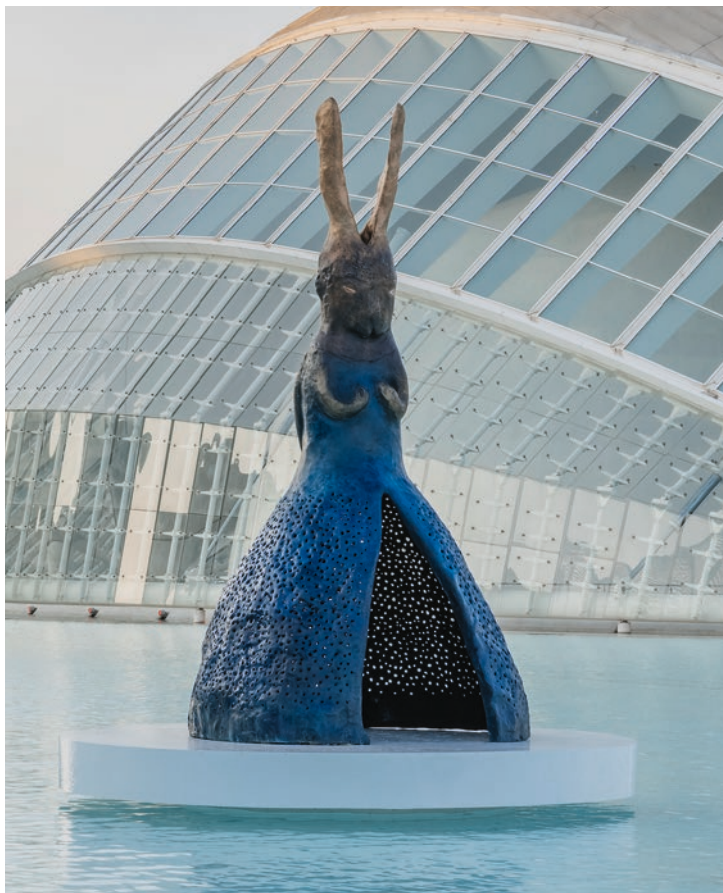
Leiko Ikemura, Usagi Greeting , 2021

Im Schach gibt es keine Geheimnisse, nur unentdeckte Wahrheiten — Savielly Tartakower (1887–1956)