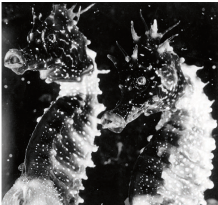
Referenzabbildung (Jean Painlevé, Männliche Seepferdchen , 1931) zu Rosemarie Trockel, Die Gleichgültige , 1994