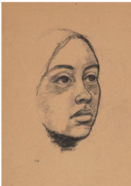
Adrian Piper, Self-Portrait in the Manner of Käthe Kollwitz , 1966