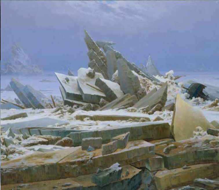
Vorderseite: 1 Wanderer über dem Nebelmeer (um 1817) 2 Mondaufgang am Meer (1822) 3 Zwei Männer in Betrachtung des Mondes (1819/20) | Diese Seite (v.l.n.r.): 4 Abend (1824) 5 Kreidefelsen auf Rügen (1818) 6 Gebirgslandschaft mit Regenbogen (1809/10) 7 Der Mönch am Meer (1808–1810) 8 Der Feldstein bei Rathen (1828) 9 Der Watzmann (1824/25) 10 Morgennebel im Gebirge (1808) 11 Selbstbildnis mit aufgestütztem Arm (um 1802) 12 Kehinde Wiley (*1977): Prelude (Babacar Mané) (2021) 13 Das Eismeer (1823/24)