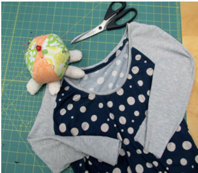
Optie a - Dubbelde biesje