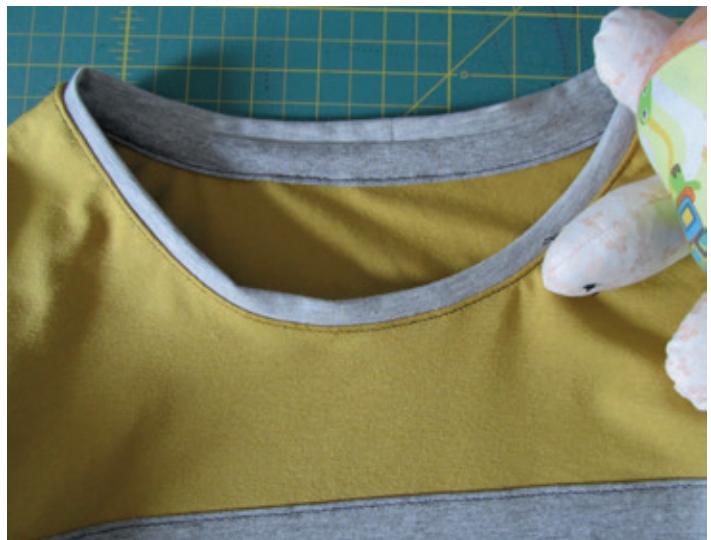
Optie b- Gevouwen biesje