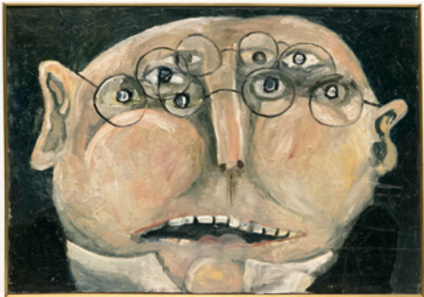
Halle1 | Tomi Ungerer: „L'Homme aux Lunettes“ („Der Mann mit Brille“), 1963, Öl auf Leinwand, 64 x 91 cm, Sammlung Würth, Inv. 6098 © Museum Würth